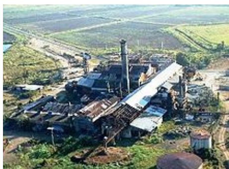
Central Coloso, Aguada, donde comenzó la huelga cañera en 1933.

En diciembre próximo se cumplirán 80 años del inicio de una de las huelgas históricas efectuadas en Puerto Rico, la huelga cañera en la que los obreros agrícolas desafiaron a los patronos del capital azucarero y a los dirigentes «obreros» que dieron la espalda a los intereses de los trabajadores. Del libro Huelga en la caña (Taller de Formación Política Ediciones Huracán, San Juan, P.R., 1982), extraemos partes del Capítulo 3, editadas por razones de espacio.