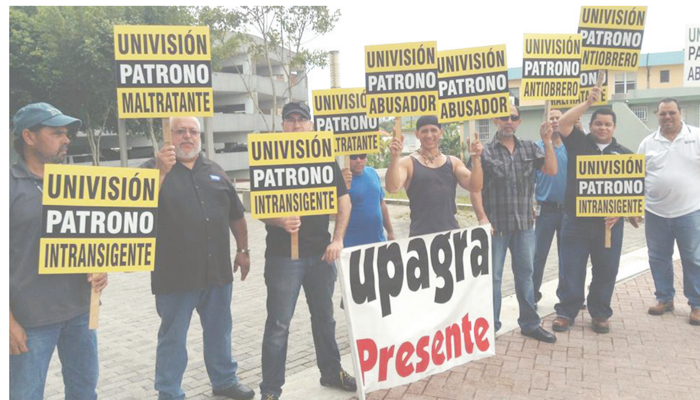
En julio pasado realizamos otra protesta contra Univisión ante la lentitud que prevalecía en la negociación colectiva.